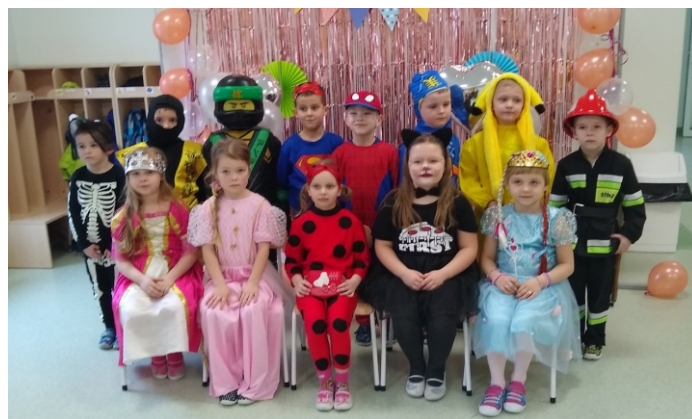
(Przedszkole Samorządowe „Pod Dębem” w Karolewie)

14 lutego przedszkole zamieniło się w zaczarowaną krainę bajek. Wszystkie dzieci pięknie przebrane bawiły się na baliku karnawałowym. Można było spotkać policjantów, strażaków, żołnierzy, piłkarzy, księżniczki, wróżki, piratów, postacie z bajek, a także zwierzęta. Przedszkolacy tańczyli do znanych utworów, a także brali udział w różnorodnych konkursach. Były pyszne słodkości oraz sesja fotograficzna, na której zostały utrwalone piękne przebrania.