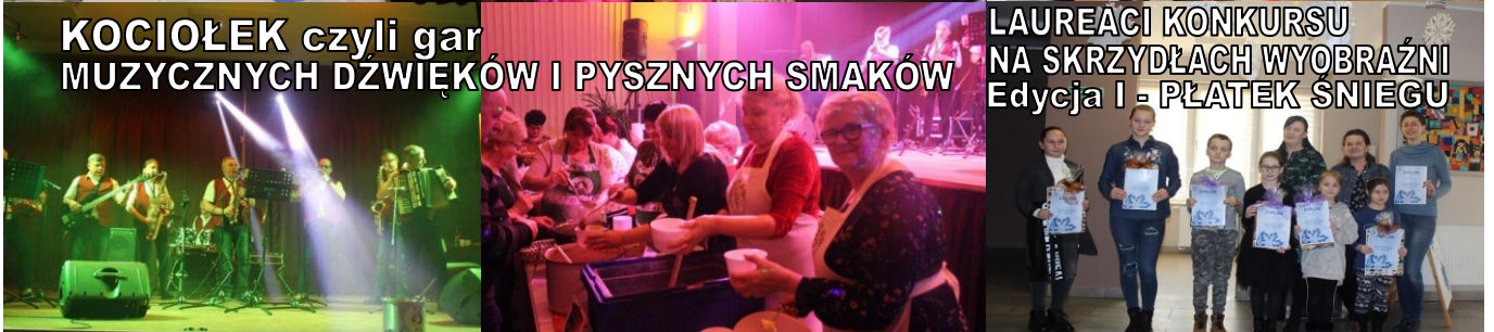
LAUREACI KONKURSU NA SKRZYDŁACH WYOBRAŹNI Edycja I - PŁATEK SNIEGU