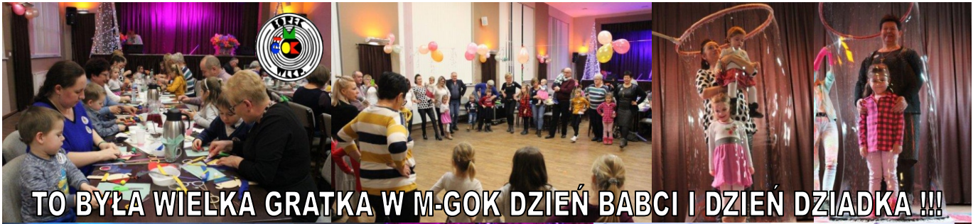
TO BYŁA WIELKA GRATKA W M-GOK DZIEŃ BABCI I DZIEŃ DZIADKA !!! KONCERT NOWOROCZNY