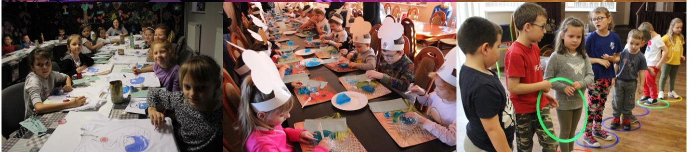
KOCIOŁEK czyli gar MUZYCZNYCH DŹWIEKÓW I PYSZNYCH SMAKÓW