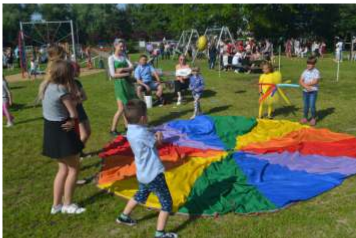
(Przedszkole „Pod Dębem” w Karolewie)

DZIĘKUJEMY WSZYSTKIM O DOBRYCH SERCACH, KTÓRZY W JAKIKOLWIEK SPOSÓB PRZYCZYNIŁI SIĘ DO UŚMIECHU NASZYCH DZIECI W TYM WAŻNYM DLANICH DNIEU.