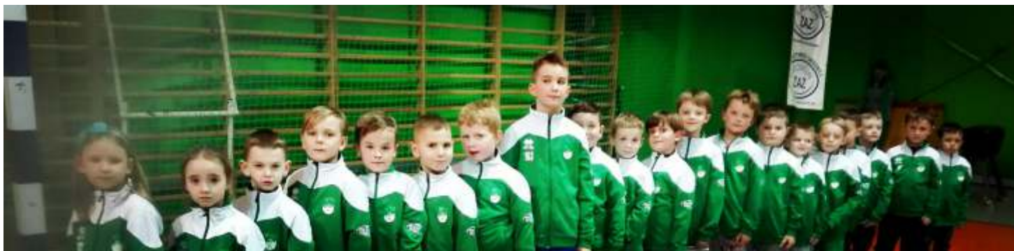
(Wisław Borek Wlkp.)

Zapisy pod nr tel. 504 504 660. Zapraszamy!