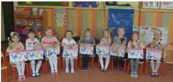
(Przedszkole Samorządowe „Pod Dębem” w Karolewie)

8 marca br. w Przedszkolu Samorządowym „Pod Dębem” w Karolewie już od rana dało się wyczuć wielkie poruszenie! Chłopcy, jak na prawdziwych dżentelmenów przystało, złożyli swoim wychowawczynom oraz koleżankom najserdeczniejsze życzenia i odśpiewali gromkie „Sto lat”. Nie zabrakło także uroczystych upominków – panie obdarowano kwiatami, zaś dziewczynki – pięknymi prezentami. Tego dnia w całym przedszkolu można było usłyszeć wesołą muzykę, w rytmie której dzieci wspólnie się bawiły i uczestniczyły w licznych konkursach. Na zakończenie uroczystości każdy mógł poczęstować się pysznymi owocami, ciastkami i babką.