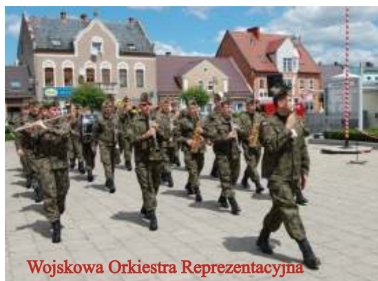
Wojkowa Orkiestra Reprezentacyjna