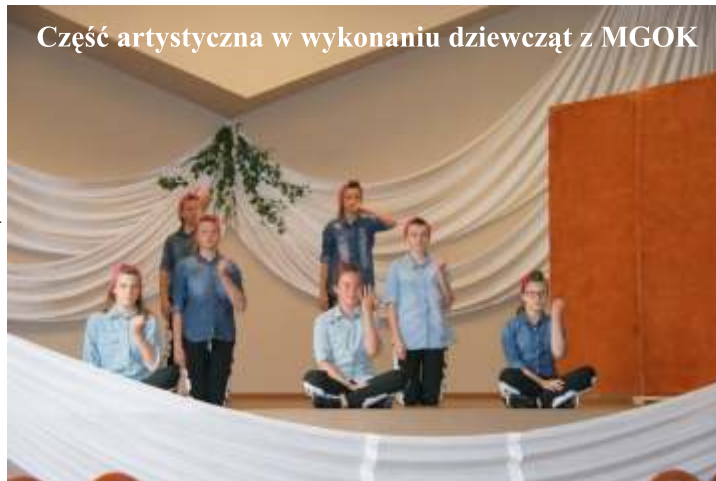
Część artystyczna w wykonaniu dziewcząt z MGOK