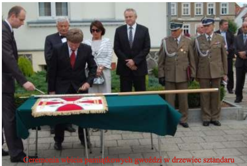
Ceremonia wbicia pamiątkowych gwoździ w drzewiec sztandaru

Serdecznie dziękujemy wszystkim, tym którzy przyczynili się do nadania nowego sztandaru i obchodów święta LOK.