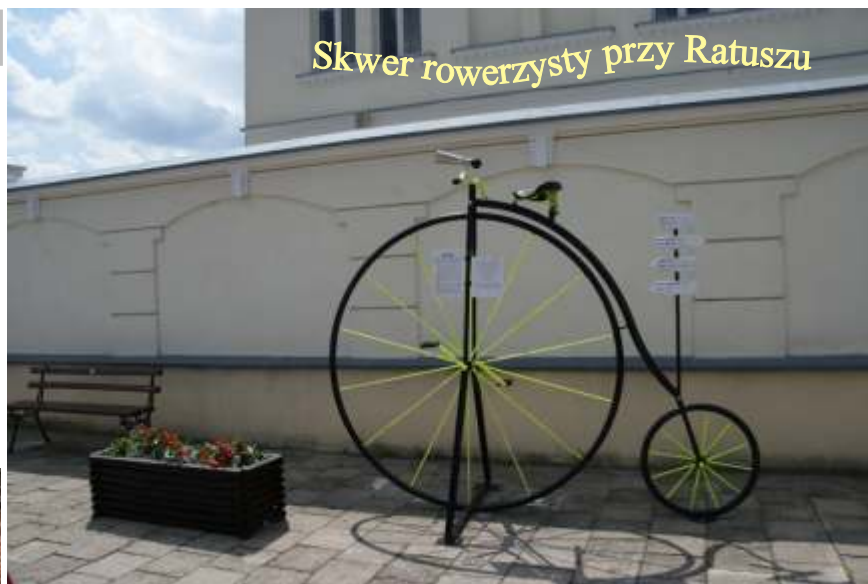
Skwer rowerzysty przy Ratuszu

były wspólne zainteresowania pomysłodawców, którzy dostrzegli, iż brakuje miejsc, które dają niezbędne informacje ludziom uprawiającym turystykę.