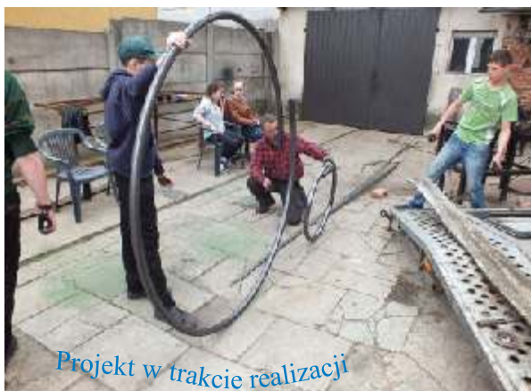
Projekt w trakcie realizacji

Jest to forma stalowego kolorowego roweru, który jest również drogowskazem i nośnikiem informacji dla podróżujących rowerzystów. Projekt ma na celu zachęcić mieszkańców do wzmożonej turystyki rowerowej w naszej okolicy. Inspiracją do stworzenia projektu