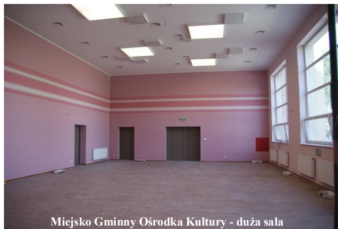
Miejsko Gminny Ośrodka Kultury - duża sala