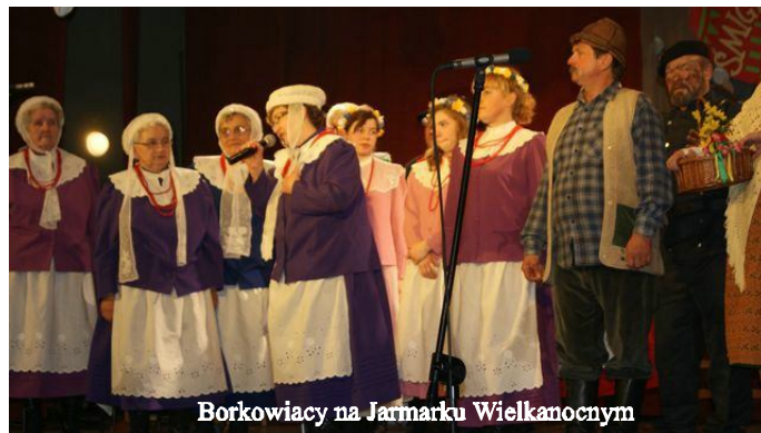
Borkowiaci na Jarmarku Wielkanocnym