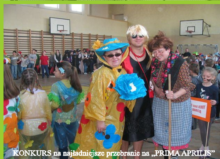
KONKURS na najładniejsze przebranie na „PRIMA APRILIS”