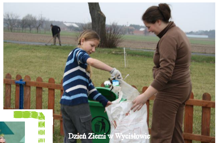
Dzień Ziemi w Wycisławie