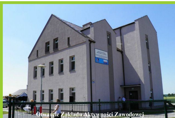
Otwarcie Zakładu Aktywności Zawodowej