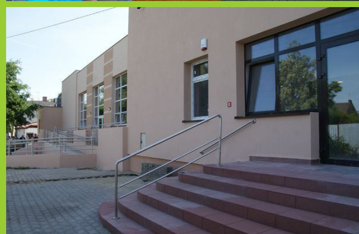
Remont Miejsko Gminnego Ośrodka Kultury