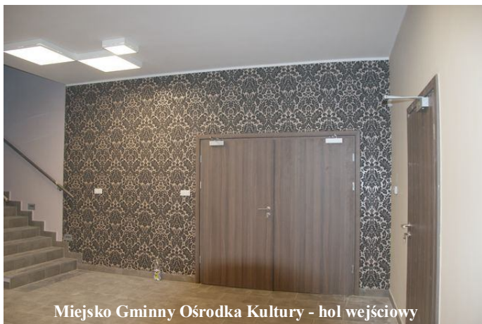
Miejsko Gminny Ośrodka Kultury - hol wejściowy