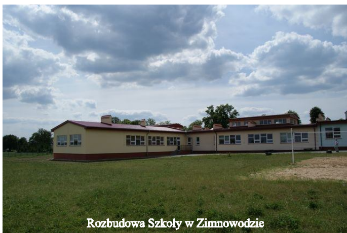
Rozbudowa Szkoły w Zimnowodzie