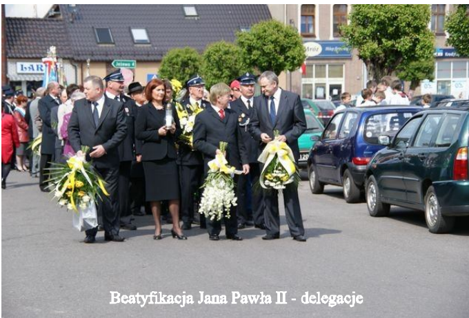
Beatyfikacja Jana Pawła II - delegacje