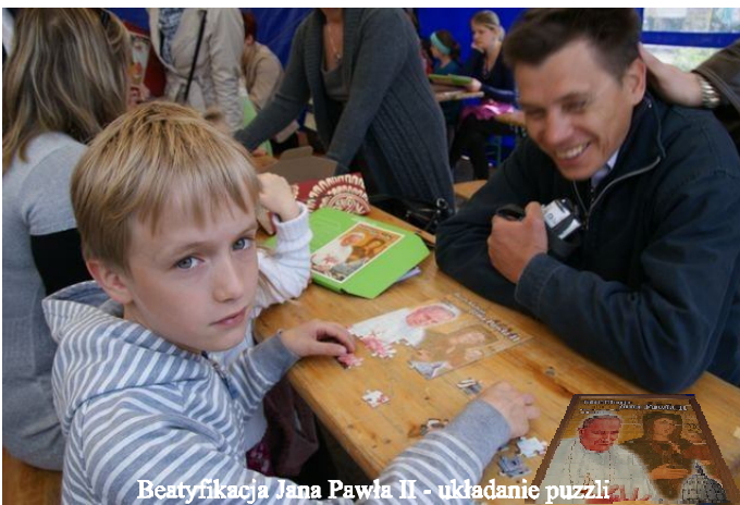
Beatyfikacja Jana Pawła II - układanie puzzli