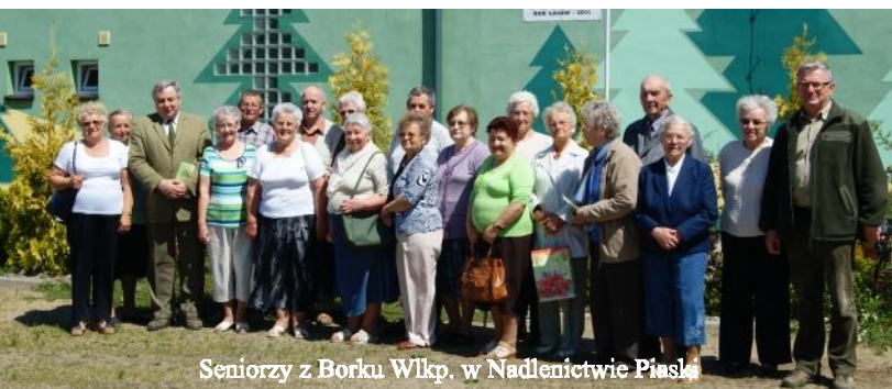
Seniorzy z Borku Wlkp. w Nadleńictwie Piaski