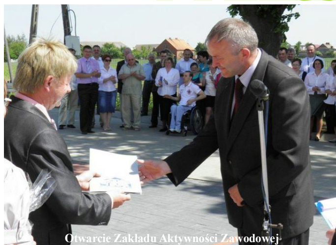
Otwarcie Zakładu Aktywności Zawodowej