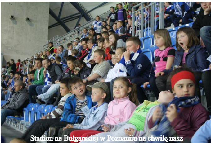
Stadion na Bułgarskiej w Poznaniu na chwilę nasz