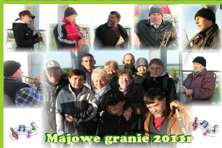
Majowe granie 2011r