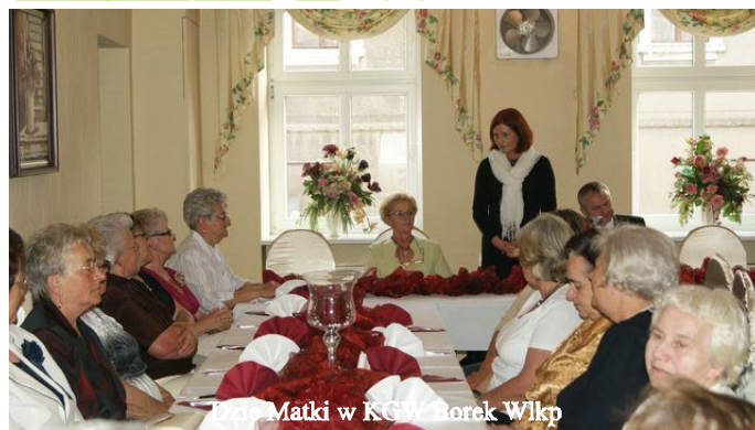
Bratni Matki w KGW Borek Wlkp