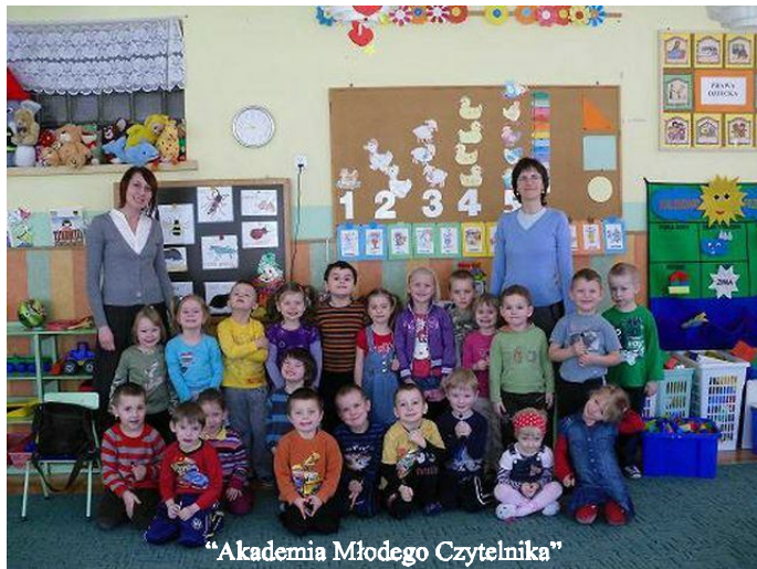
"Akademia Młodego Czytelnika"