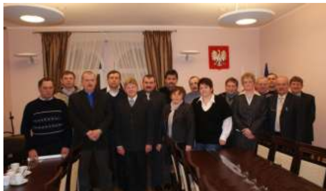
Sołtysi kadencji 2011-2014

Jak Państwo zauważyliście 8 wsi sołectkich dokonało zmian na stanowisku sołtysa. Gratulujemy wyborcom sołtysom i radom sołectkim oraz zapraszamy do owocnej współpracy.