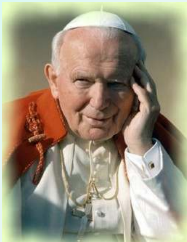
Jan Paweł II 18.05.1920 - 02.04.2005

Burmistrz Borku Wlkp., Ksiądz Proboszcz Parafii pw. Pocieszenia Najświętszej Maryi Panny w Borku Wlkp. oraz Strażacy zapraszają księży z okolicznych parafii, wszystkich mieszkańców a szczególnie młodzież na UROCZYSTĄ MSZĘ ŚWIĘTĄ połączoną ze spotkaniem śpiewno-modlitewnym