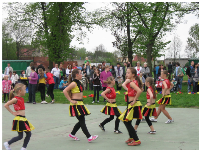
FESTYN Z OKAZJI 2 MAJA