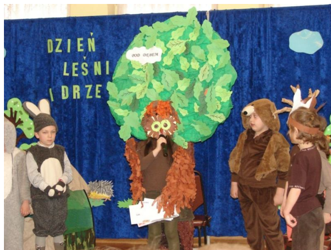
DZIEŃ PATRONA PRZEDSZKOLA SAMORZĄDOWEGO POD DĘBEM