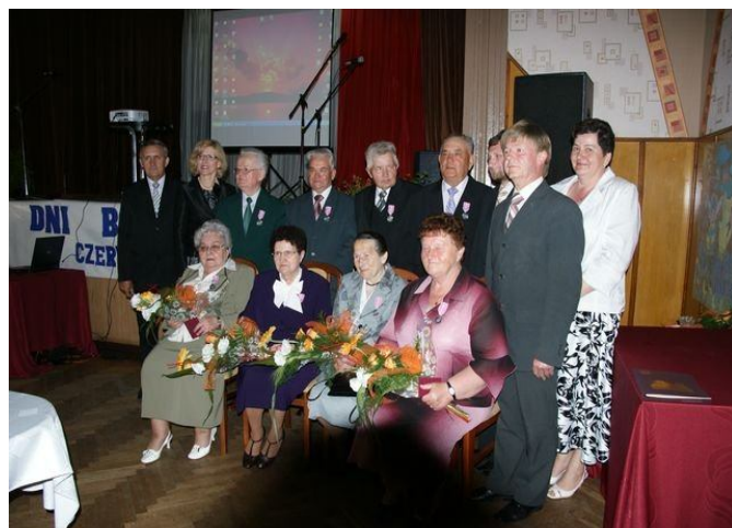
“UROCZYSTA SESJA RADY MIEJSKIEJ BORKU WLKP”