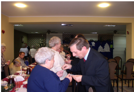
Największa radość to móc dzielić się opłatkiem z naszymi mieszkańcami.