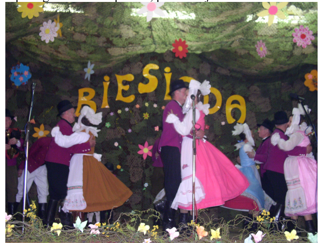
„Spotkanie z Piosenką Biesiadną” – kwiecień 2006r.

Przeгляд Kołed i Pastorałek-Rawicz, Koncert Kołed i Pastorałek-Gostyń, Przeгляд Grup Jasełkowych i Kołedniczych –Śmigiel, Przeгляд Widowisk „Wielkanoc w Tradycji”- Lipno, XXIII Międzywojewódzki Sejmik Zespołów Teatralnych-Grotniki, Święto Pieśni i Muzyki Południowo-Zachodniej Wielkopolski, Przeгляд Zespołów Ludowych-Pakosław, Krobskie Spotkania z Folklorem, Spotkania Zespołów Ludowych-Dębno Polskie, Wakacyjny Festyn Gołaszyniaków, Dożynki Parafialne-Siciny, Dożynki Gminne-Dolsk, Dożynki Parafialne- Gola. Zespoły wielokrotnie występowały przed publicznością borecką, były współorganizatorem spotkań, prezentacji i koncertów.