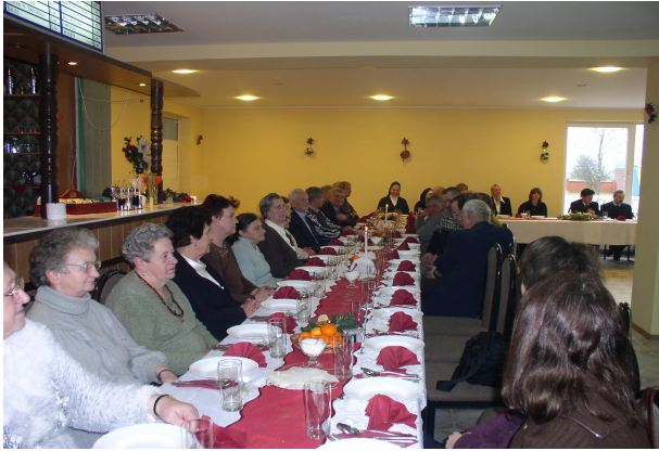
Pamiętka z najpiękniejszego dnia w roku jakim jest WIGILIA BOŻEGO NARODZENIA